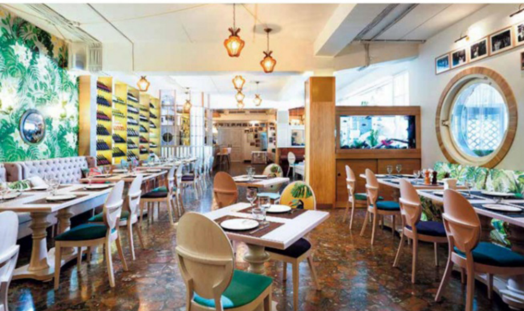
Яркие обои от салона French Touch поддерживают тропические мотивы в этом проекте. Мебель для проекта — работа салона French Touch