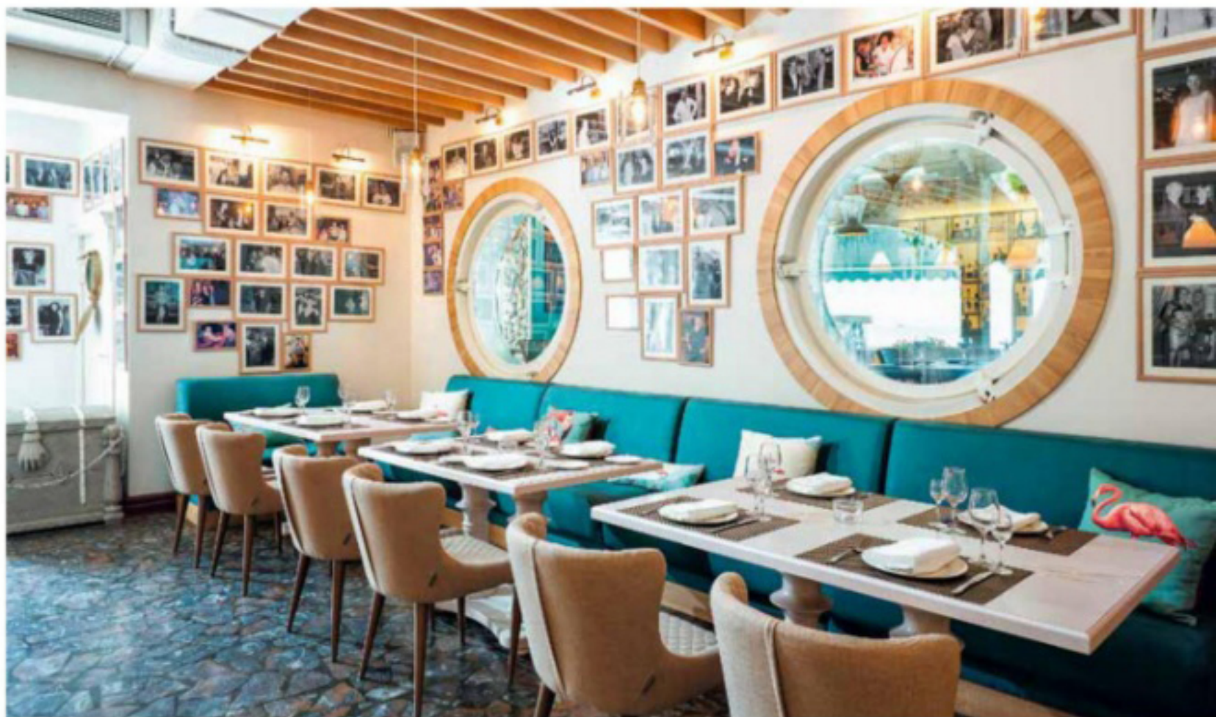
Текстиль для проекта дизайнеры выбрали в салоне French Touch